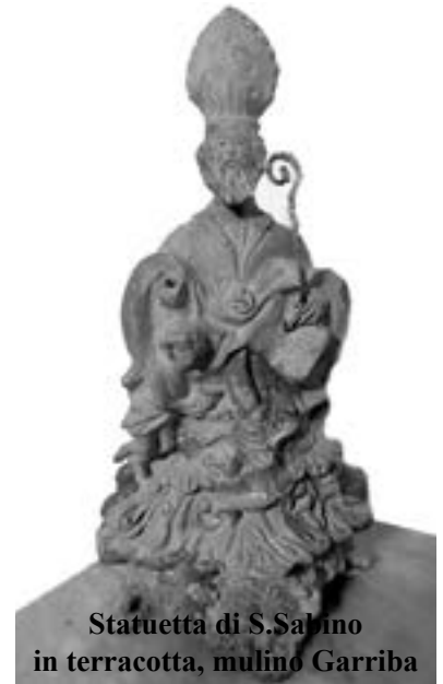
Statuetta di S. Sabino in terracotta, mulino Garriba

venga confinata entro i limiti angusti di una fede ingenua, relegata nei confini espressi da una statua o da una immagine perché si compia il miracolo. In tal caso, la contraddizione prorompe e si evidenzia - la vicenda terrena di San Sabino, la sua opera realizzata per amore di Dio, ma anche della sua gente e del territorio, ci è di esempio - nel momento in cui la città di oggi, in alcune espressioni della propria socialità, sembra non capire a fondo, non riuscendo a testimoniarla nei fatti, la relazione, duratura nel tempo, che rende viva e attuale l'eredità che Egli ha lasciato alle successive generazioni che hanno abitato Canosa: una città da amare, da rispettare, da difendere, da onorare.