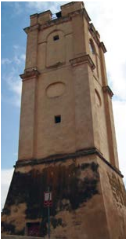
Borgo Antico, Torre dell'Orologio