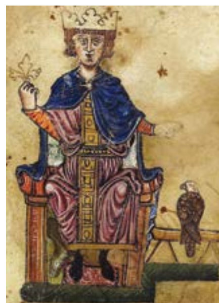
Federico II

A partire dal periodo aragonese (XV sec.) fino a quello borbonico (XVIII-XIX sec.), il maniero fu utilizzato soprattutto come residenza feudale . Pertanto, è documentata una successione di varie famiglie aristocratiche che vi risiedettero per amministrare il feudo canosino. Dopo gli Orsini del Balzo (XV sec.), possiamo citare i Grimaldi di Genova-Monaco (XVI sec.), gli Affaitati di Barletta (XVII sec.), per giungere ai Capece Minutolo di Napoli (XVIII-XIX sec.). Tra la fine del '600 e il '700, il complesso fu convertito a palazzo