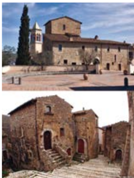
I borghi di Solomeo (in alto, immagine tratta da ili6.files.wordpress.com) e di Santo Stefano di Sessanio (in basso, immagine tratta da countryhouseabruzzo.com)

In Italia, troviamo diversi esempi di ripristino. Tra i più illustri, annove-