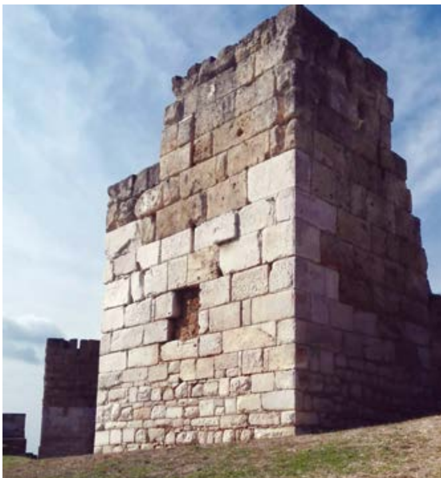
Castello, Torre nord-orientale

termini cronologici) dell'opulenta Canusium romana come della fiorentissima città daunia: un riferimento politico, istituzionale e militare, posto su uno dei punti privilegiati, con vista dalle Murge al Tavoliere, dal Vulture al mare; una posizione non casuale per un presidio a guardia della città e del suo territorio.