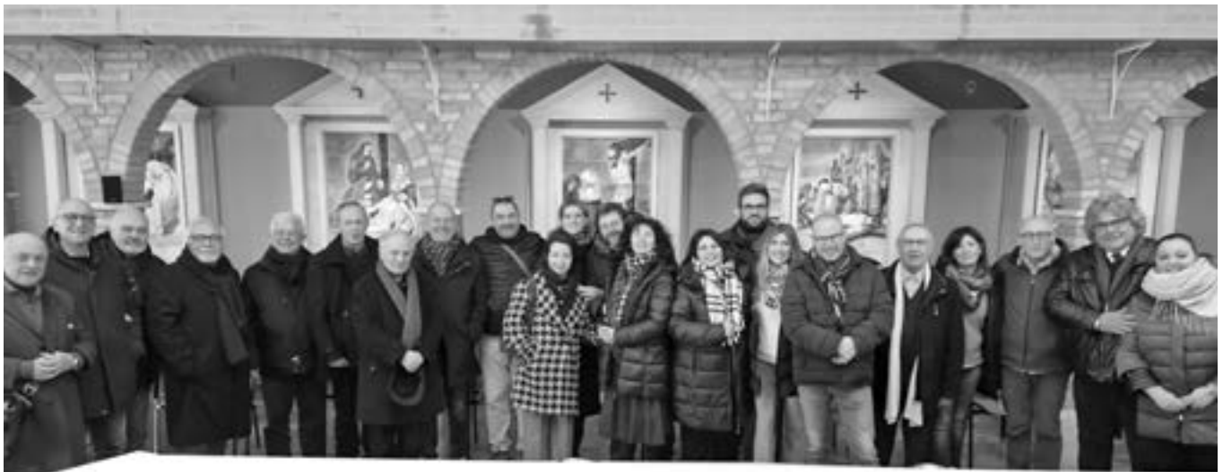
Foto di gruppo di alcuni giornalisti che hanno partecipato alla Celebrazione Eucaristica, in occasione della memoria liturgica di San Francesco di Sales, 24 gennaio, Patrono dei giornalisti. Santuario del SS.mo Salvatore.

nell'esercitare la professione del giornalista, guardando all'essenziale, senza strumentalizzazioni e senza cercare il consenso a tutti i costi, o mossi da altri interessi. In un tempo in cui parole e