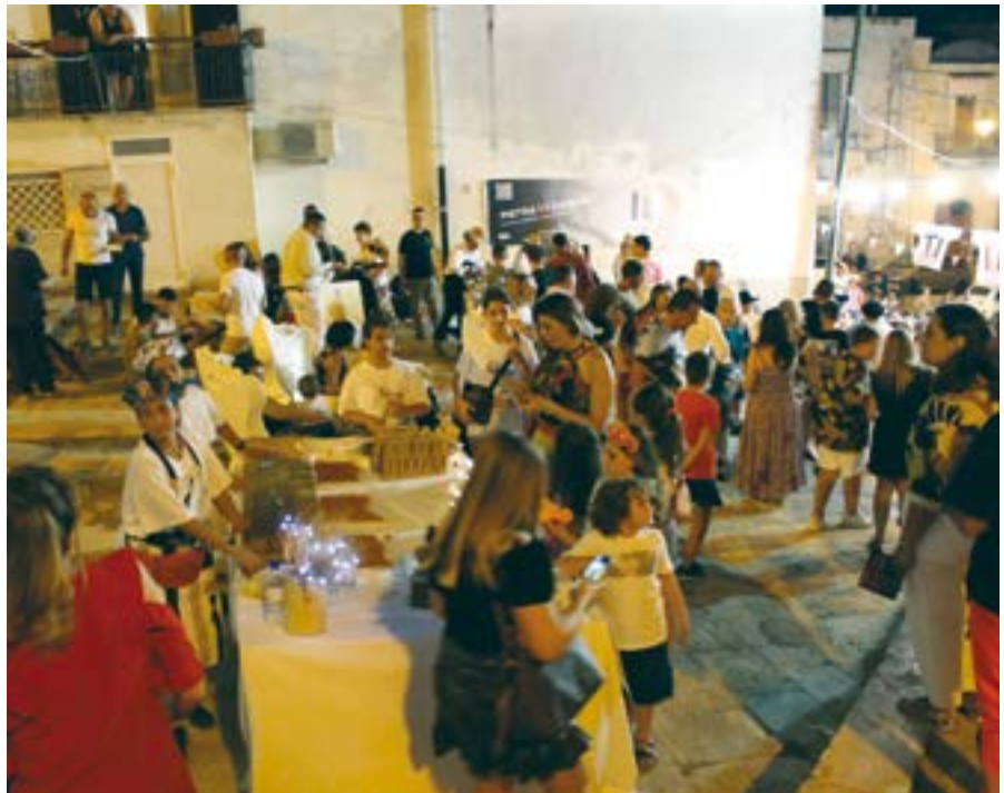
Un momento di "Tipicamente Canosa" nel borgo antico, 2022

del quale persero la vita 53 cittadini . Infine, proprio a ridosso del castello, nel forno angioino, una collezione di cimeli contadini è visitabile in occasione di eventi.