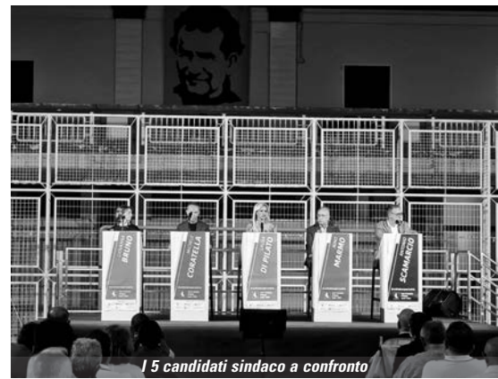
I 5 candidati sindaco a confronto

L'evento si è svolto in un luogo storico di Andria, il cortile dell'Oratorio Salesiano che è casa che accoglie, parrocchia che evangelizza e scuola che prepara alla vita. Luogo di svago e palestra di formazione per tanti giovani andriesi passati, presenti e futuri. Luogo neutro, ma non neutrale perché culla di quell'impegno alla partecipazione attiva che Don Bosco riassume nel motto "Buoni cristiani e onesti cittadini".