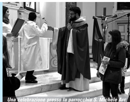
Una celebrazione presso la parrocchia S. Michele Arc.

dopo circa 2 mesi, ne siamo usciti molto provati e la sofferenza ci ha cambiati . Si auspicava che potessimo cambiare in meglio, ma la diffidenza, la paura, le difficoltà economiche e l'impossibilità di progettare hanno creato nuovi stili di vita e nuove abitudini che non mi sono sembrati sempre buoni. La fede e la vita non riescono ancora ad incontrarsi, scorrono su due binari paralleli . Si partecipa alle celebrazioni eucaristiche in modo frettoloso e distratto, tanto si può continuare a seguirle in Tv, come si è fatto durante il lockdown.