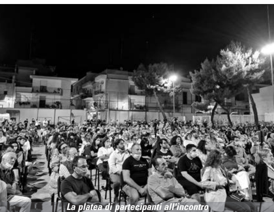
La platea di partecipanti all'incontro

Un momento di sana e leale competizione elettorale che ha sicuramente lasciato il segno nella storia politica della Città di Andria poiché esperienza concreta di una Chiesa attenta ai segni dei tempi e agorà dove è stata garantita una sana competizione elettorale.