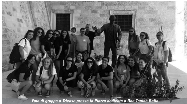
Foto di gruppo a Tricase presso la Piazza dedicata a Don Tonino Bello

Come ricompensa della fatica mattutina, abbiamo trascorso un rilassante pomeriggio presso la località marittima di Marina Serra, particolare per le sue piccole grotte. In serata abbiamo avuto modo di esplorare il centro storico di Tricase tra locali e turisti, passando per la piazza dedicata a don Tonino dove abbiamo scattato una foto con la sua statua. Il giorno seguente abbiamo raggiunto Marina di Pescoluse, a circa mezz'ora da Tiggiano, e goduto delle sue acque cristalline per l'intera mattinata all'insegna del divertimento e ... di tuffi dal pedalò. Santa Maria di Leuca, la località più a sud della Puglia, dove si possono vedere le correnti dell'Adriatico e dello Ionio incon-