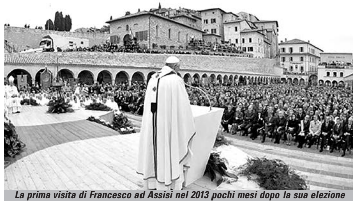
La prima visita di Francesco ad Assisi nel 2013 pochi mesi dopo la sua elezione

Come ricordava Alessandro Gisotti in un editoriale pubblicato a luglio sull'Osservatore Romano «sull'asse della fratellanza ruota tutto il pontificato di Francesco». «"Fratelli" – scriveva il vicedirettore editoriale del Dicastero vaticano per la comunicazione – è proprio la prima parola che ha rivolto al mondo da Papa, la sera del 13 marzo del 2013 ». «Fraterno» è poi «anche il modo in cui definisce il suo rapporto con il Papa emerito Benedetto XVI». «Dopo la firma del Documento sulla fratellanza umana, – osservava Gisotti – tale cifra del Pontificato appare certamente più marcata ed evidente a tutti». «Eppure, – aggiungeva – ripercorrendo all'indietro i primi sette anni di Pontificato di Francesco, si ritrovano diverse pietre miliari sul cammino che ha condotto