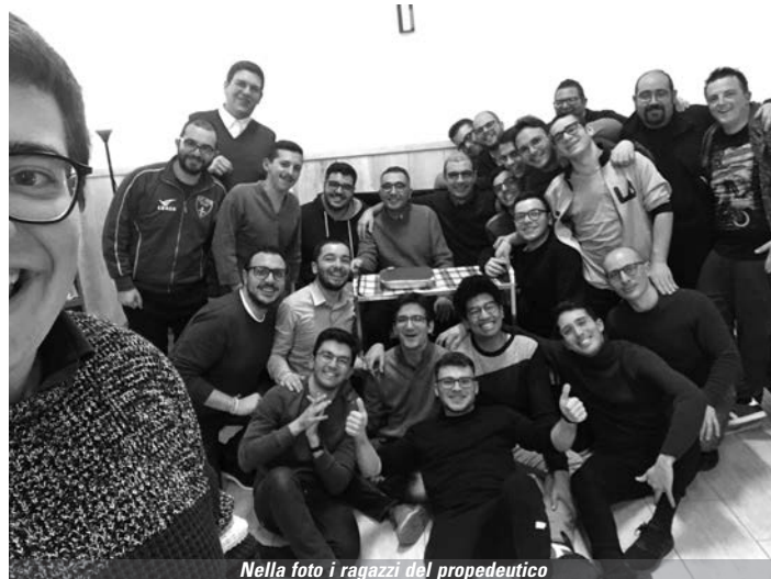
Nella foto i ragazzi del propedeutico

L'attenzione dei sacerdoti educatori e dei docenti, le amicizie nate nella prima parte dell'anno, ci hanno aiutati a non fermare il nostro Propedeutico che, in questo preciso momento storico, più che un luogo è diventato un tempo, un modus vivendi . Il nostro percorso è continuato anche a distanza , fino al momento in cui, con gioia, ci siamo ritrovati tutti per vivere l'ultimo periodo insieme per concludere l'anno nel pieno rispetto delle norme anti-covid, così come è stato per i miei fratelli condioocesani che, con i rispettivi corsi di teologia, si sono ritrovati in tempi diversi, a tirare le somme del proprio cammino. In questo tempo in cui ci prepariamo all'inizio di un nuovo percorso siamo trepidanti di ricominciare poiché, come dice don Fabio Rosini, "la vita è una serie infinita di inizi" ( L'arte di ricominciare , ediz. Paoline).