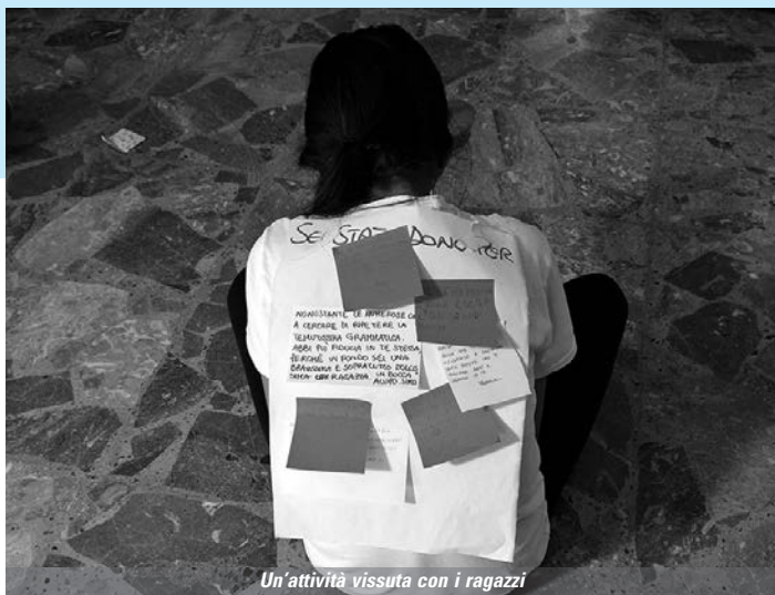
Un'attività vissuta con i ragazzi

L'estate è il tempo in cui i ragazzi dell'AVS possono sperimentare in una sola volta quanto durante l'anno vivono nella formazione, nel servizio, nella promozione, nella vita comunitaria, attraverso i campi di lavoro. Questa estate non è stata possibile. Il coronavirus non ci ha permesso di tornare ad incontrare i nostri amici in Italia o all'estero e ci ha "costretti" a rimanere a casa. Ma qui c'è stata la svolta. Abbiamo ripensato ai nostri obiettivi, abbiamo riletto la situazione e ci si siamo detti che anche ad Andria, anche con i nostri ragazzi, potevamo fare qualcosa di nuovo, di diverso! Ecco allora alcune iniziative che ci hanno fatto quasi letteralmente sfiorare il cielo con un dito... Sentiamo i nostri giovani: