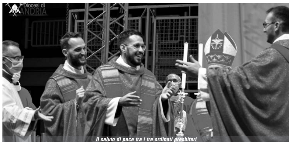
Il saluto di pace tra i tre ordinati presbiteri

progetto, facendomi sentire ovunque una persona autentica. Con questa consapevolezza e tra le non poche difficoltà in cui ho stretto più forte la mano del Signore e abbracciato di più i "volti amici" ho terminato gli studi, rientrando poi in diocesi per vivere il ministero del Diaconato e prepararmi al presbiterato. Tutto è stato "grazia". Gli incontri, gli sguardi, le parole, gli abbracci, i suggerimenti, i diverbi, i rimproveri sono stati la Grazia che ha plasmato la mia umanità. Un'umanità di cui sono grato al Signore non perché perfetta ma perché abitata da Lui. Per grazia chiedo di rimanere uomo nel mio presbiterato, per essere visitato e rinnovato ancora una volta nelle mie fragilità, nei miei errori e nei miei paradossi. Per grazia chiedo di essere uomo "fino in fondo e fino in cima" come diceva e lo era don Tonino Bello. Per Grazia chiedo di essere un presbitero coi piedi radicati in terra e il cuore legato ad un lembo di cielo. Per Grazia chiedo di poter imparare a rispondere giorno per giorno ad una chiamata di fronte alla quale mi sento ancora indegno ma capace di generare gioia dentro di me. Nella mia vita il Signore ha compiuto molto di più di quanto avrei fatto io con i miei progetti e questo per me è il senso della mia vocazione. Certo di dover invocare sempre la sua misericordia sulla mia persona mi affido alla preghiera della mia chiesa diocesana che con materna cura non mi farà mai mancare.