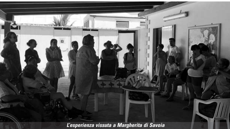
L'esperienza vissuta a Margherita di Savoia

Siamo grati per ciò che l'Anno di Volontariato Sociale ci ha permesso di scoprire e approfondire. Ogni momento è stato anche l'opportunità di conoscere di più noi stessi e far luce su ciò che siamo: un altro pezzo è stato aggiunto al puzzle della nostra vita e non vediamo l'ora di poter trovarne altri, mettendo a frutto tutto quello che abbiamo imparato.