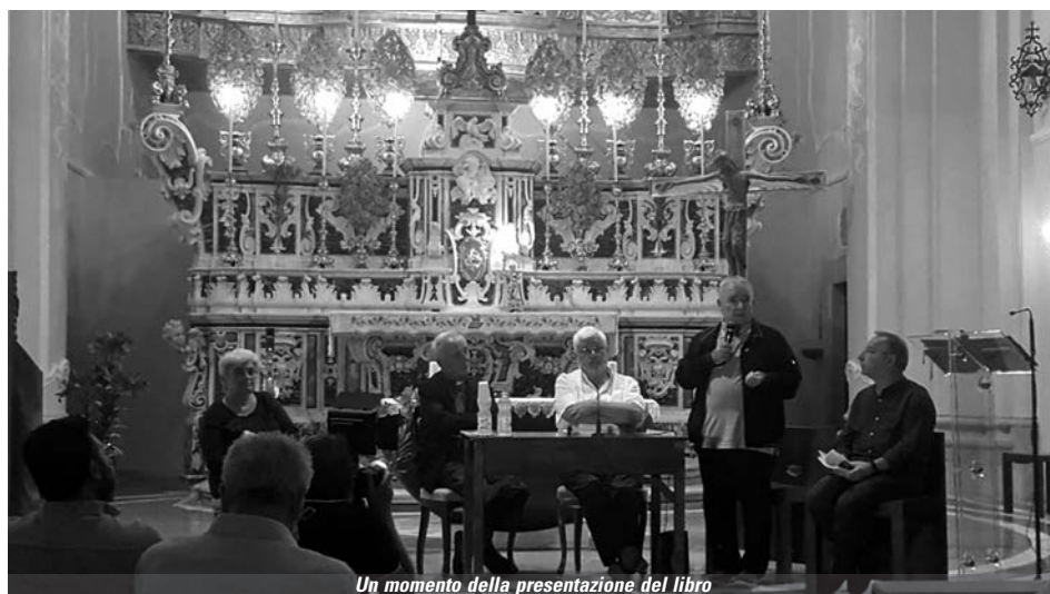
Un momento della presentazione del libro

Banchetto pro-vocatorio , infatti, significa un banchetto aperto all' "Altro" e a tutti senza discriminazioni, "pro" non "senza" o "contro", e "vocatorio", che chiama tutti, senza distinzione alcuna, a realtà esistenziali, interiori e visibili, più grandi, più profonde, più universali, ... eterne, richieste dalla fede in Gesù Cristo, Figlio di Dio fatto uomo, dalla rivelazione dell'Amore del Padre dei cieli, dal dinamismo dello Spirito di Dio che porta a compimento lungo le generazioni la salvezza compiuta dal Sacrificio della Croce e dalla Risurrezione di Gesù, in attesa del Regno definitivo di Dio.