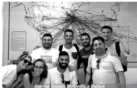
Impresa Sociale Moltivolti, a Ballarò

quelle dei loro figli, che si sono ritrovati ad avere due fratelli in più e a condividere quella che era la loro quotidianità e i loro spazi. Si è trattata di una scelta coraggiosa e sicuramente forte, non affatto facile, raccontano, che ha dato uno scossone non indifferente. È emersa l'immagine di una Palermo al fianco dei più deboli, che ha a cuore ogni singola persona, consapevole della strada ancora da percorrere e di quanto ci sia ancora da lavorare per educare all'accoglienza e all'integrazione dell'altro.