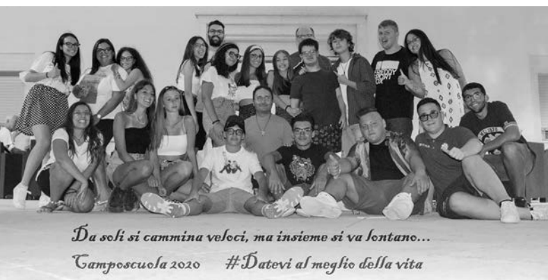
Da soli si cammina veloci, ma insieme si va lontano... Camposcuola 2020 #Datevi al meglio della vita

In particolare, il filo rosso che ha guidato i ragazzi e gli adulti durante le esperienze estive è stato tratto dal messaggio della 57a Giornata Mondiale di Preghiera per le Vocazioni, " Datevi al meglio della vita ", che papa Francesco ha rivolto a ogni giovane nella recente Esortazione apostolica Christus vivit . Attraverso l'esperienza estiva in oratorio e i campi-scuola abbia-