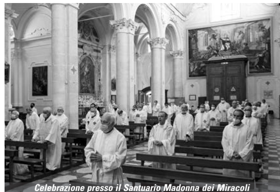
Celebrazione presso il Santuario Madonna dei Miracoli

E allora, carissimi tutti, facciamo tesoro di queste lezioni che la vita e la storia ci hanno consegnato in questi mesi e riprendiamo il nostro cammino di Chiesa con l'ardente proposito di non disperdere niente di ciò che, pur nella sventura, la provvidenza ha disposto per noi. Buon cammino annuale a tutti e a tutte le comunità della nostra Chiesa!