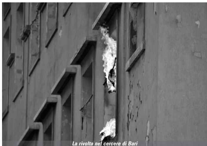
La rivolta nel carcere di Bari

Allora mi rivolgo ai politici ribadendo di abbandonare la strada del parlare alle pance delle persone, perché così facendo ne usciamo tutti sconfitti. Facciamo piani rieducativi, finanziamo i volontari in carcere e i progetti di misura alternativa al carcere-