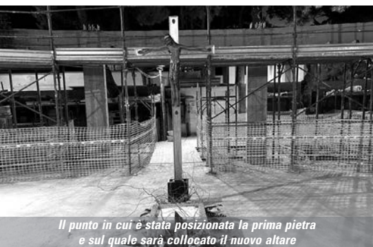
Il punto in cui è stata posizionata la prima pietra e sul quale sarà collocato il nuovo altare

La comunità parrocchiale eleva inni di lode a Cristo, "pietra angolare", benedice il Padre, esulta nello Spirito e si rallegra per questi nuovi segni della Provvidenza divina.