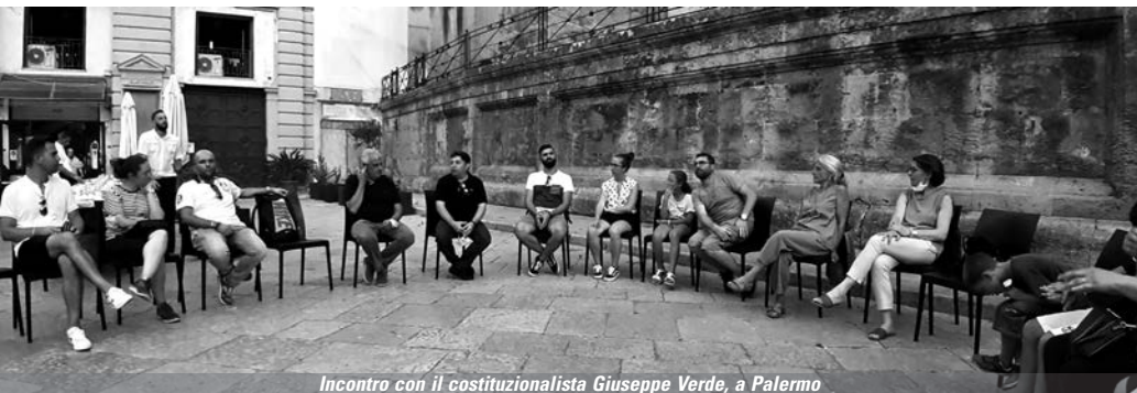
Incontro con il costituzionalista Giuseppe Verde, a Palermo

Non sono mancati anche i momenti che ci hanno permesso di godere delle bellezze naturalistiche e dei panorami mozzafiato della Sicilia come l'escursione alla Riserva dello Zingaro e alla Riserva dei laghetti di Marinello ai piedi del Santuario di Tindari. Siamo certi del fatto che, in ognuno di noi, questa esperienza estiva abbia lasciato un ricordo indelebile e speciale e ci abbia fatti tornare a casa con qualche consapevolezza in più di ciò che la Sicilia, terra a metà tra dannazione e meraviglia, sia.