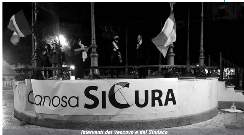
Interventi del Vescovo e del Sindaco

Un regolamento di conti che dichiara la prepotenza della criminalità. Sembrano affermare con forza che la Giustizia e lo Stato non esistono più. I padroni delle sorti del territorio e della vita delle persone è nelle loro mani. Atti criminali a cui non possiamo e non dobbiamo piegarci ma, soprattutto, a cui non dobbiamo abituarci. È necessario, invece, prenderne consapevolezza e chiamare per nome ogni singolo atto di criminalità, poiché a pagarne le spese non sono solo le vittime interessate bensì tutti i cittadini. Non è più tempo per rimanere indifferenti! Troppe volte, sotto i nostri occhi e nell'assordante silenzio di tutti, si sono manifestate le più brutali conseguenze di una piaga che non avrà mai fine se non con il coraggio di non arrenderci alla prepotenza del male che attanaglia le nostre vite e le sorti politiche, sociali ed economiche del nostro territorio. Il silenzio mette in pericolo la democrazia. Bisogna credere che ogni cittadino possa fare la sua parte contro il radicamento mafioso nelle nostre città. Perché, come cita il secondo paragrafo del-