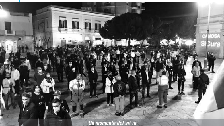
Un momento del sit-in