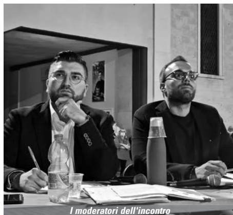
I moderatori dell'incontro

L'incontro pubblico non è stata una passerella elettorale nè, tantomeno, il palcoscenico dove i candidati sindaco hanno raccontato fiabe per bambini o rigurgitato programmi elettorali. Sono stati approfonditi con sincerità e lealtà alcuni aspetti che il Forum diocesano ha ritenuto di fondamentale importanza per la campagna elettorale, per i cittadini, per Andria tutta, e che tradizionalmente sono al centro dell'attenzione dei percorsi formativi: bilancio e finanze locali