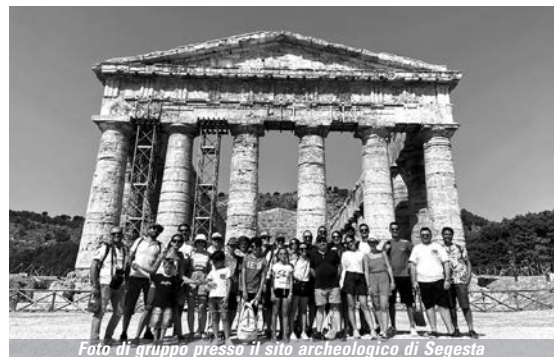
Foto di gruppo presso il sito archeologico di Segesta

In particolare, ci hanno raccontato la loro scelta di accogliere all'interno della propria famiglia due ragazzi provenienti dal Marocco e di come tale decisione abbia cambiato non solo le loro vite, ma anche