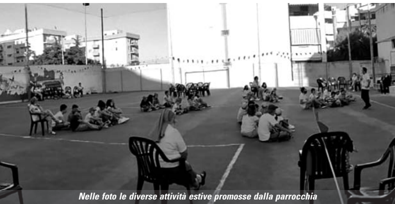
Nelle foto le diverse attività estive promosse dalla parrocchia

J ovanotti cantava: "Che bello è ..." e noi continuiamo la frase così: "Che bello è ritrovarsi tutti insieme in oratorio, dopo mesi e mesi di chiusura forzata ...". È stata un'estate diversa quella che si è appena conclusa , ricca di nuove sfide da affrontare, ma con il consueto desiderio di vivere, insieme a piccoli e grandi come famiglia, esperienze formative e di divertimento dopo mesi e mesi di distanza fisica dalla vita parrocchiale.