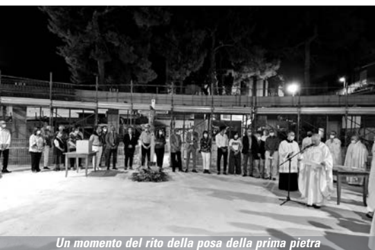
Un momento del rito della posa della prima pietra