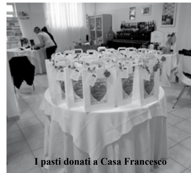
I pasti donati a Casa Francesco

arrivate offerte raccolte in occasione di funerali, preferendole all'acquisto di fiori. Sono costanti le iniziative di Associazioni, gruppi, aziende, che con generosità sostengono Casa Francesco, diventata un punto concreto di riferimento cittadino e interparrocchiale per coloro che desiderano collaborare. Ci sia consentita un'ultima iniziativa, in senso cronologico, da evidenziare: martedì 22 dicembre l'Istituto di Istruzione Secondaria Superiore, Indirizzo Alberghiero di Canosa, con il patrocinio del Comune, ha organizzato la manifestazione 1° PRANZO DEL CUORE, donando a Casa Francesco oltre cento pasti. Un grazie di vero cuore a tutti coloro che rendono possibile l'attività di questa mensa solidale e un doveroso ringraziamento all'O.R. per la preziosa quotidiana collaborazione nell'organizzazione.