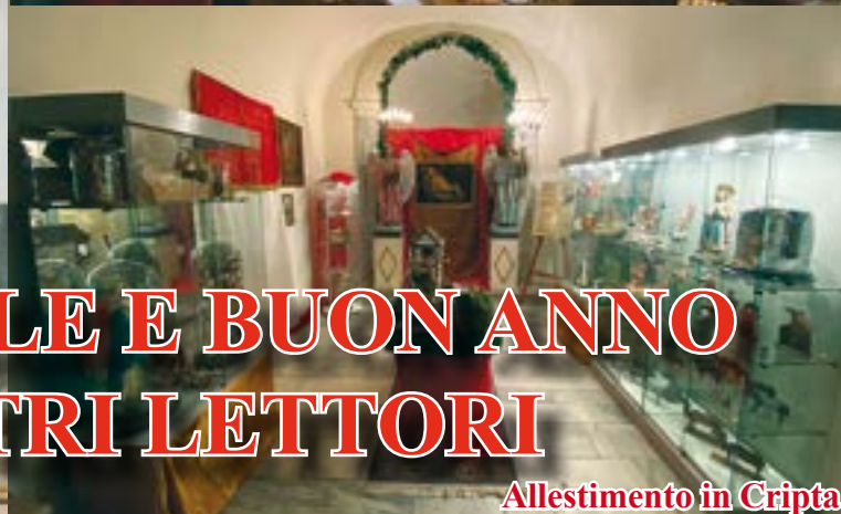
Allestimento in Cripta

BUON NATALE E BUON ANNO AI NOSTRI LETTORI