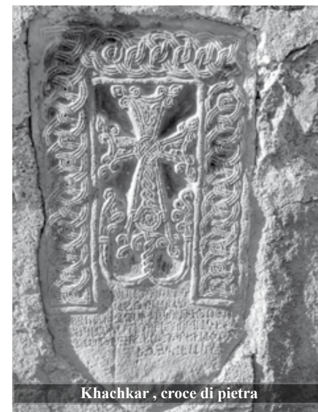
Khachkar, croce di pietra

*Docente di lingua italiana all'Università Brusov di Yerevan e all'Università Americana in Armenia, collabora per alcune testate armena e italiane.