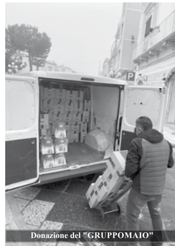
Donazione del "GRUPPOMAIO"