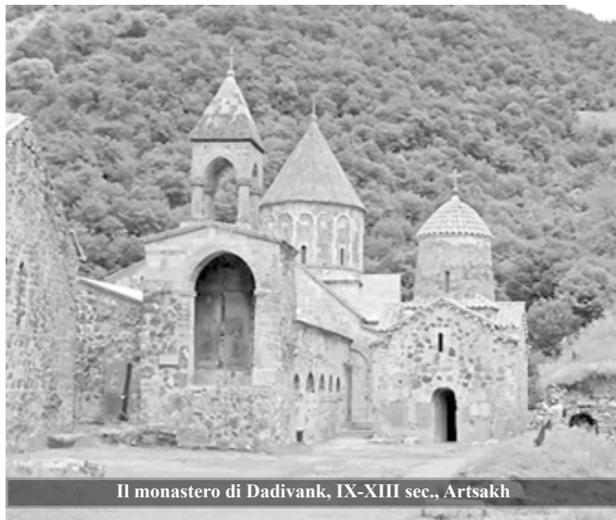
Il monastero di Dadivank, IX-XIII sec., Artsakh