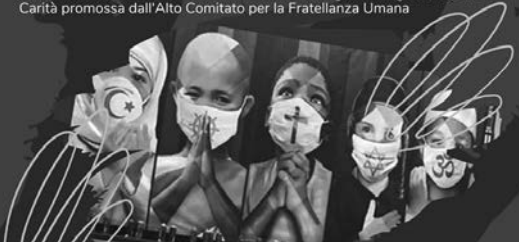
Tavola rotonda in occasione della Giornata di Preghiera, Digiuno, Opere di Carità promossa dall'Alto Comitato per la Fratellanza Umana

CONSIGLIO PARROCCHIALE DI AZIONE CATTOLICA IN NOME DELLA FRATELLANZA UMANA TRA SOLITUDINE E CONDIVISIONE