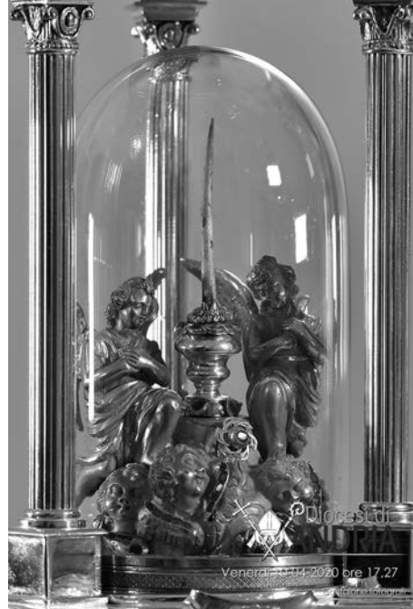
L'inatteso segno sulla Sacra Spina

Per questo motivo, il Vescovo ha ritenuto di condividere questi fenomeni prima con i confratelli sacerdoti e quindi con tutti i fedeli, dandone personalmente annuncio alle ore 20.00 del Venerdì Santo, al termine della Via Crucis da lui presieduta e trasmessa in diretta da Teledehon. Come Pastore, egli ha sentito il dovere di testimoniare quanto visto e condiviso seppur con pochi, che si è presen-