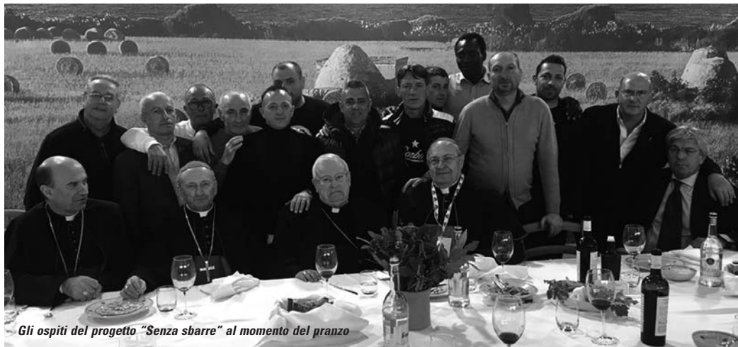
Gli ospiti del progetto "Senza sbarre" al momento del pranzo