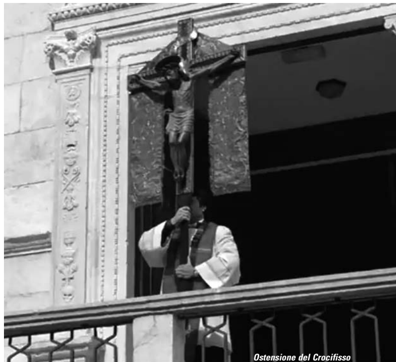
Ostensione del Crocifisso

La nostra "cara Madonna del Sabato" , che nella tradizione popolare con il suo manto protegge tutti, non ci ha abbandonati neanche in questo periodo difficile. Non è mancata la novena a partire dal venerdì dell'ottava di Pasqua, durante la quale i sacerdoti si sono soffermati nella predicazione commentando "le sette gioie di Maria" . In occasione della festa i nostri sacerdoti