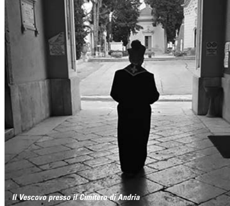
Il Vescovo presso il Cimitero di Andria

Anche il progetto "Senza Sbarre" , che attua la misura alternativa al carcere, nonostante