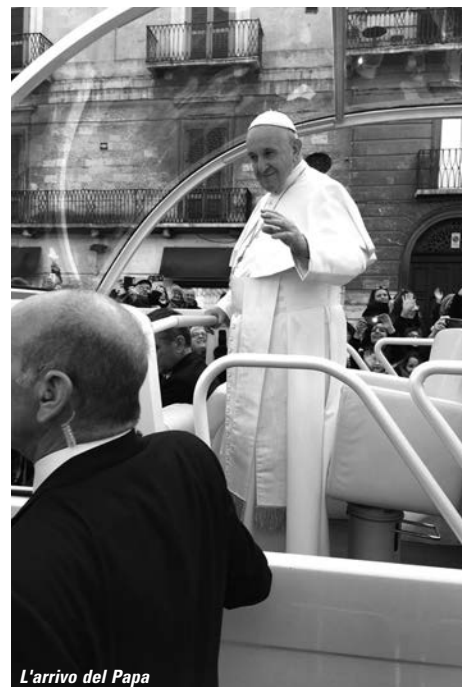
L'arrivo del Papa

Ecco le nostre risposte: "Senza altro è stata un'esperienza mai vissuta finora e che porterò nel cuore". "Questa giornata mi ha dato l'opportunità di conoscere persone importanti che si sono poste in ascolto dei nostri problemi". "È impossibile dimenticare tutto quello che abbiamo vissuto". "È stato molto bello vedere il Papa per la prima volta da vicino e stare a tavola con cardinali e vescovi". "Non credevo ai miei occhi nel vivere una giornata così memorabile". "È stata una cosa bellissima stare al tavolo presidenziale per il pranzo con cardinali e vescovi".