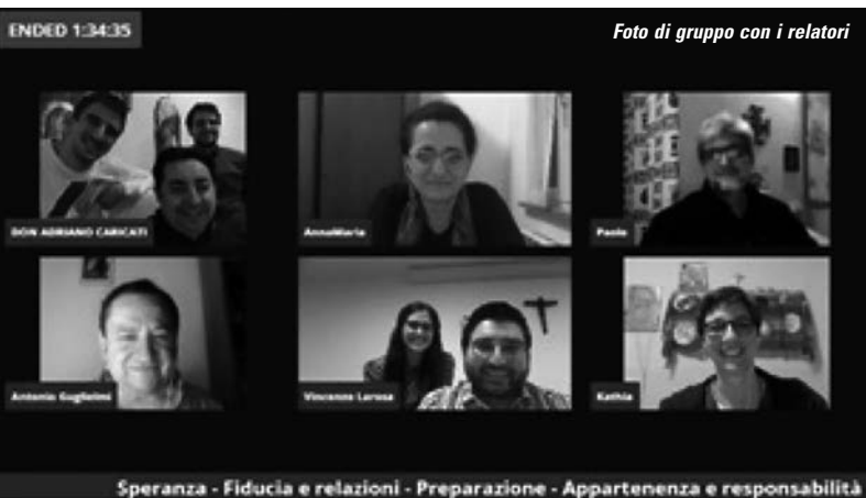
Tavola Rotonda di AC della parrocchia Sacro Cuore di Gesù