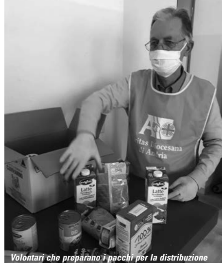
Volontari che preparano i pacchi per la distribuzione

In questo periodo di approfondimento del lavoro dei volontari, ho ascoltato molte storie, esperienze e parole; alcune di queste parole hanno sostato maggiormente nei miei pensieri, riecheggiando e diventando motivo di stupore nuovo nel pensare alla bellezza del