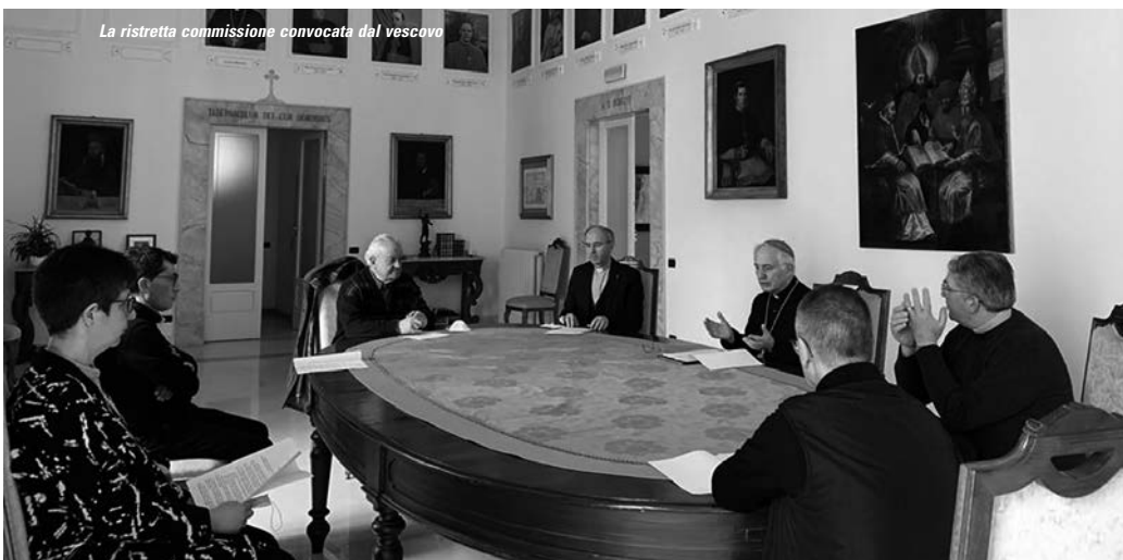
La ristretta commissione convocata dal vescovo

In continuità con le decisioni prese nel 2005 e nel 2016, tutto è stato verbalizzato e notificato per tramandarne testimonianza.